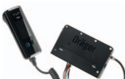
Håndsett og styreenhet Interlock® 7000