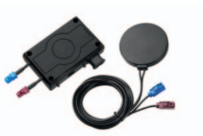
GRPS-modul Interlock® 7000