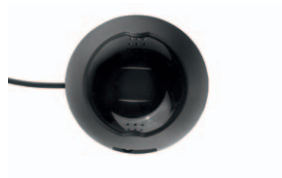
Kamera Interlock® 7000