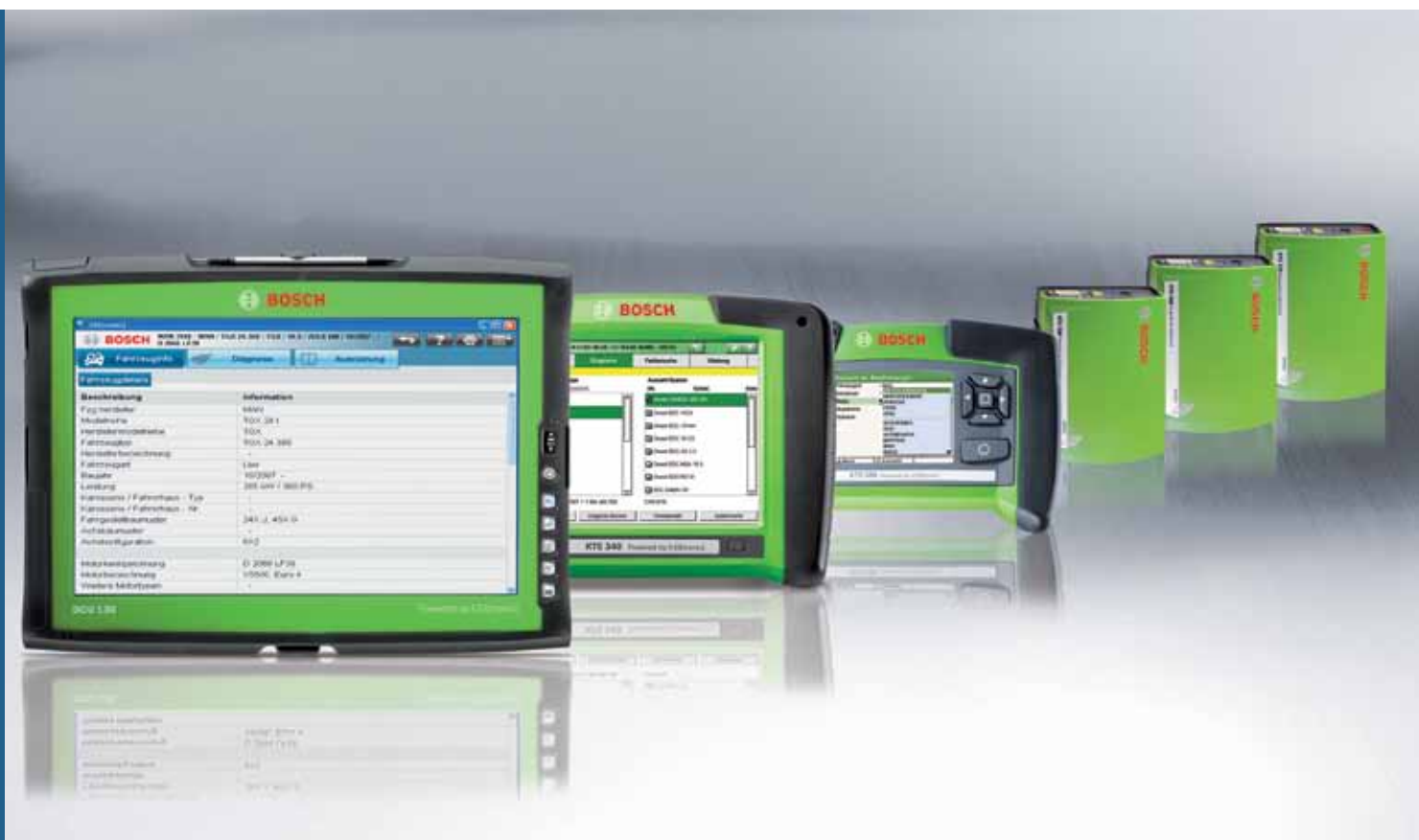
Testutrustning från Bosch i KTS-serien och ESI[tronic] 2.0 – fungerar bra tillsammans.